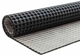
NOPPENMATTE 20 GP